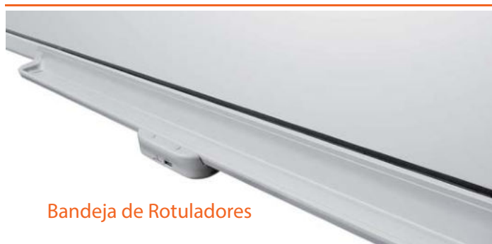
Bandeja de Rotuladores